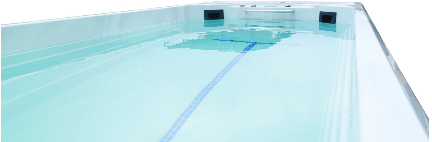
Timax SLS 6000 Inground

Alle drei Modelle sind von Werk aus ausgerüstet mit einer leistungsstarken Gegenstromanlage, einer Heizung bis 40 Grad Wassertemperatur, einem Ozongenerator und LED-Lichtprogrammen zur Farb- und Lichttherapie. Vielfältige Kontroll- und Einstellungsmöglichkeiten regeln Massagedüsen, Wasserpflegeprogramme und Energiespar-Modi. Optional nachrüstbar sind ein beleuchteter Wasserfall und der Heizbetrieb per Wärmepumpe. Mit einem Swim Spa von Timeless S.p.a. kommen Nutzer gleichzeitig in den Genuss von Swimmingpool, Fitnessanlage und Wellness-Oase.