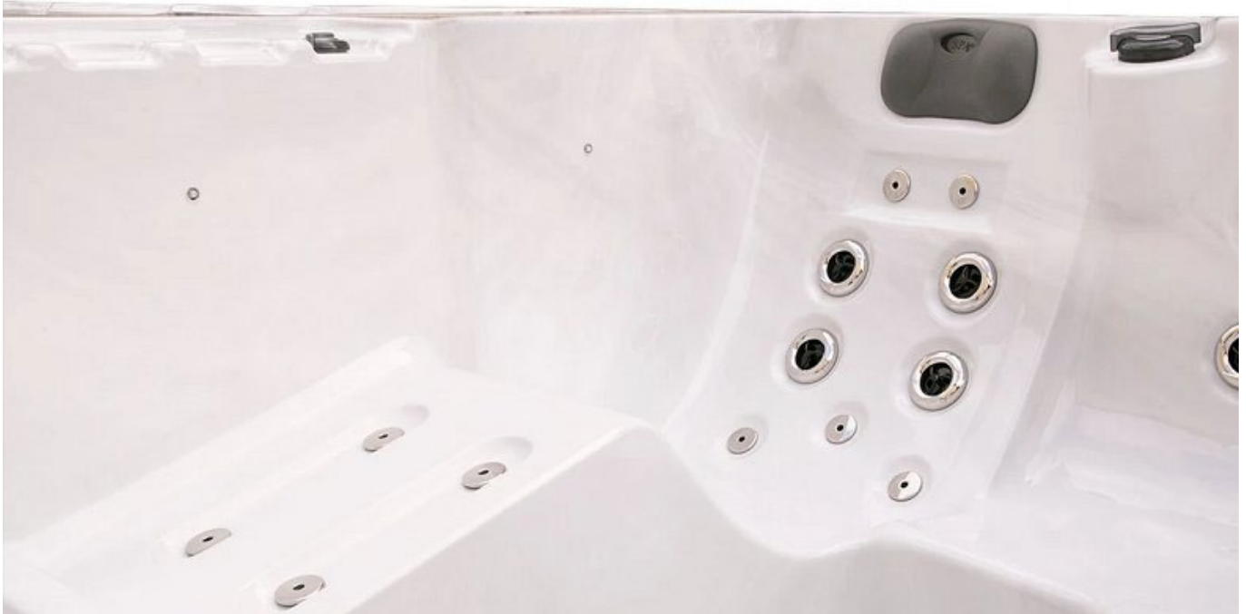
Whirlpoolbereich des Timax SLS 680

Das Wasser in Swim Spas muss nur selten gewechselt werden. Spezielle Filtersysteme halten es klar und sauber, sodass es zwischen drei und zwölf Monaten im Pool bleiben kann – noch ein Vorteil in Hinsicht auf Betriebskosten und Umweltverträglichkeit.