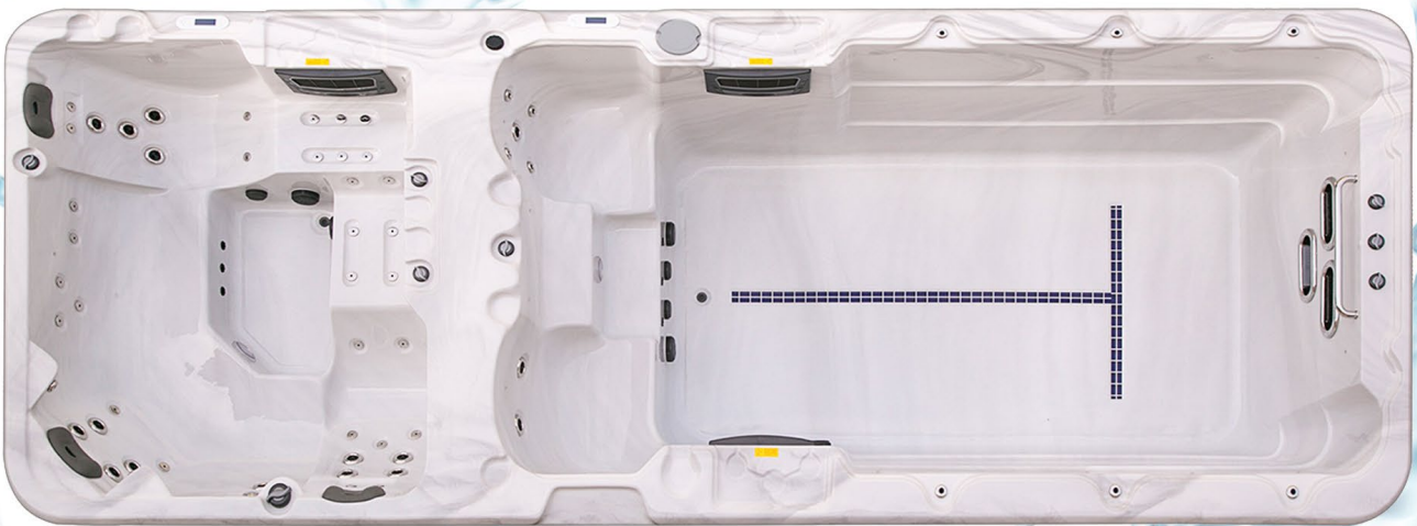
Swim Spa Timax SLS 680

Ein Swimmingpool benötigt viel Platz, Energie, Wasser und gutes Wetter. Ein Whirlpool bietet das ganze Jahr über Spaß, aber wenig Platz zum Auspowern. Das Beste aus beiden Geräten vereinen Swim Spas: kompakte, kostengünstige Wannen für drinnen oder draußen, ausgestattet mit Gegenstromanlage, Massagedüsen, Heizung und vielen weiteren Extras.