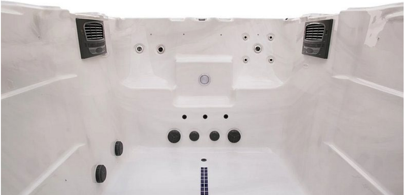
Edle Materialien, edle Verarbeitung: der Timax SLS 680

Im Gegensatz zu herkömmlichen Swimmingpools, die viel Platz beanspruchen, haben Swim Spas kompakte Ausmaße. Sie eignen sich daher auch für kleinere Außenbereiche und lassen mehr Raum für Gartenbau und Landschaftsgestaltung.